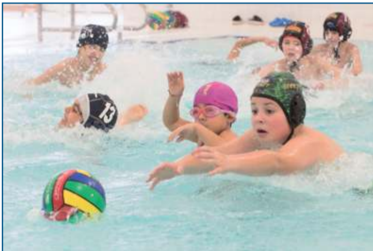
Venga... ¡a por el balón!

do alegrías. Porque si quienes conforman el club tuvieran que echar mano de una palabra para describirlo dirían éxito. "La convocatoria navideña del pasado año tuvimos 15 chaval@s, y éte ha igualado a la participación a los campus de abril y septiembre", explican. En total 39 niños y niñas de 6 a 13 años que se animaron a conocer el practicar el waterpolo del 2 al 4 de enero.