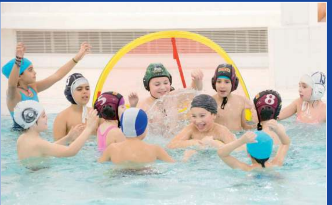
Un poco de jaleo en la portería, que nunca viene mal.