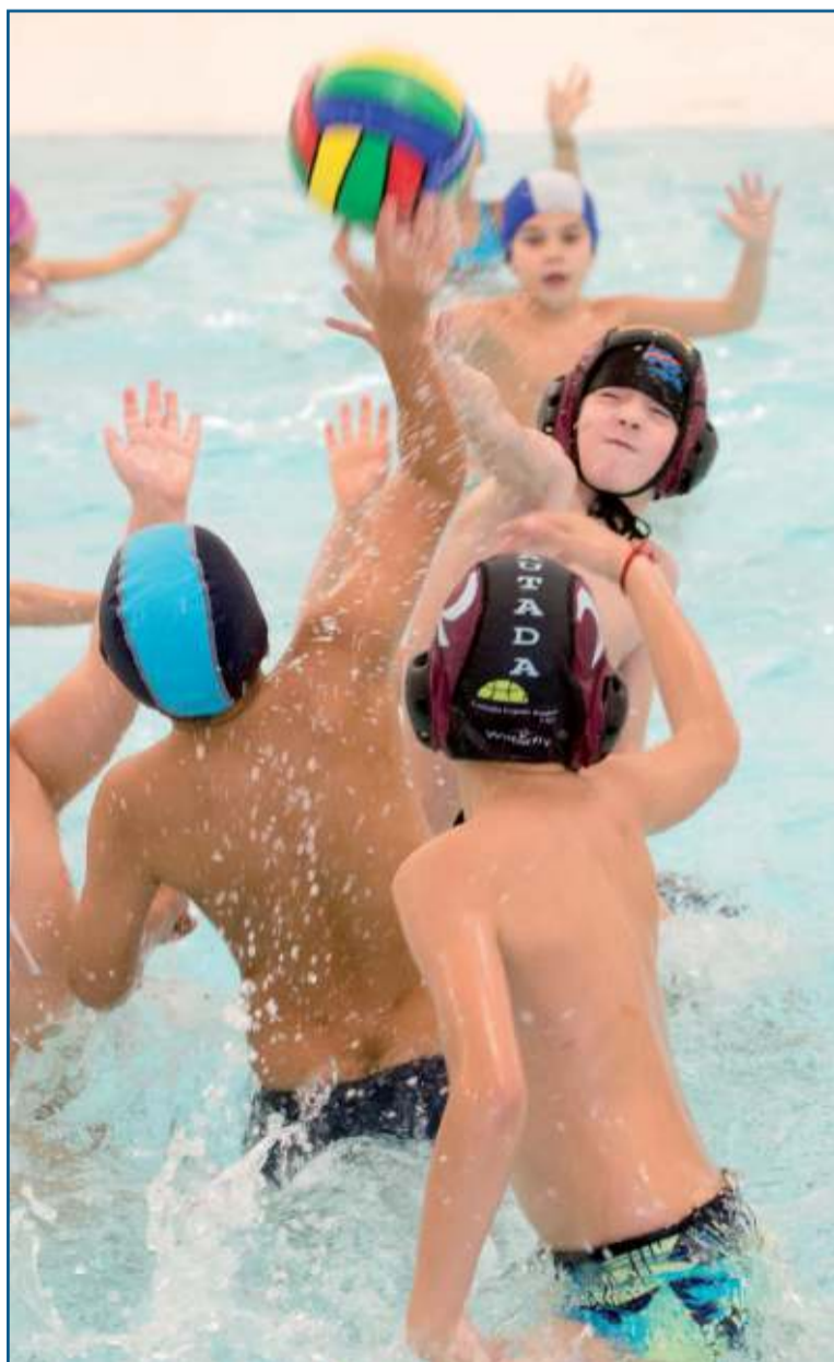
Intentando bloquear el lanzamiento.