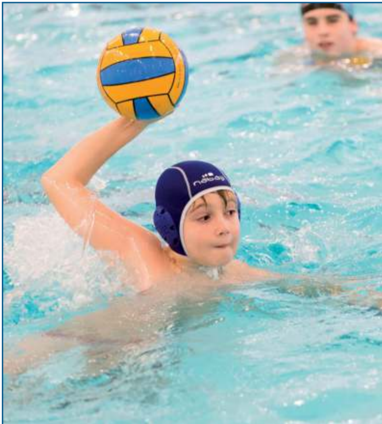
Practicando el tiro a puerta.