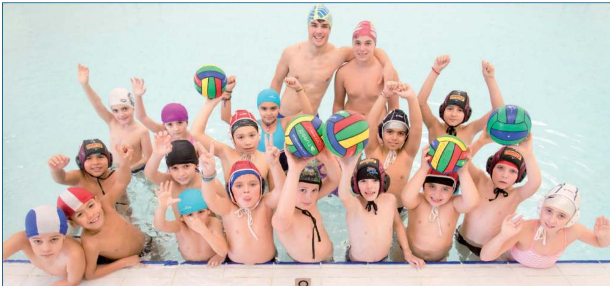
Los más txikis disfrutando del campus de waterpolo en las piscinas de Lakua.