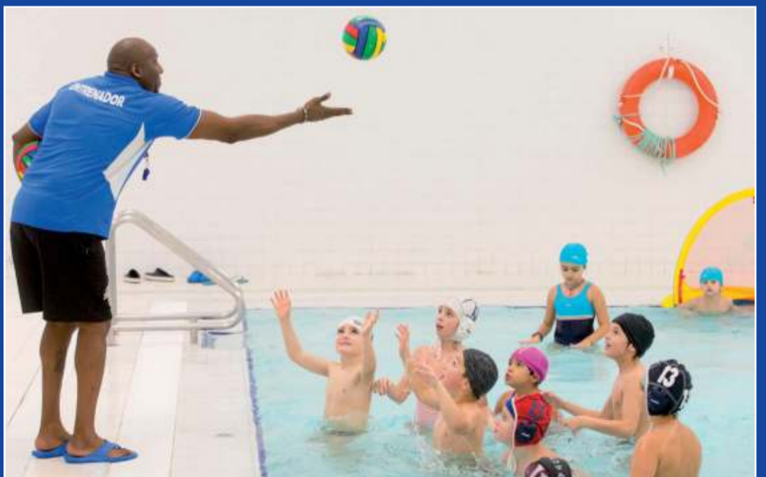
A ver quién lo pilla primero.